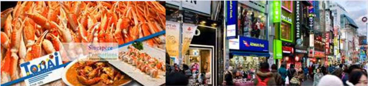
ของหวานสุดฟิน